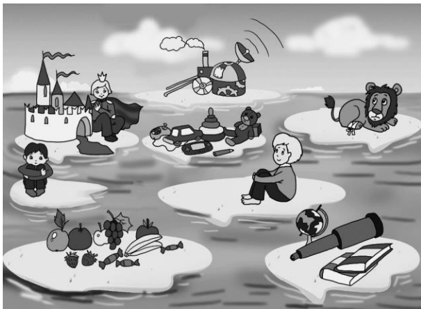
Рис. 2. Выбери остров

можешь узнать что-то новое, интересное ( показать ); на шестом ты станешь изобретателем и научишься делать все, что захочешь ( показать ); на седьмом собраны интересные игрушки ( показать ). Выбери остров, на который ты хочешь отправиться больше всего, и поставь на него свою фишку.