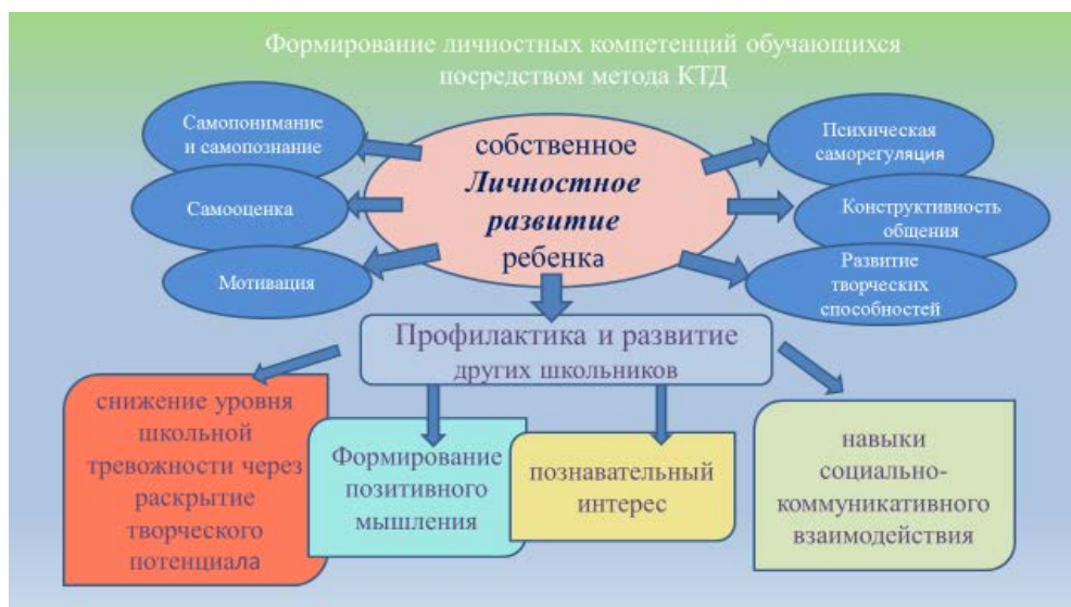
Рисунок 2 - Формирование личностных компетенций обучающихся посредством метода КТД

Цель занятий и других мероприятий, которые проводят дети - не только собственное личностное развитие, но и их персональный вклад в профилактику школьной тревожности через раскрытие творческого потенциала других (младших) школьников, собственно формирование у них эмоционально положительного отношения к школе, активизацию познавательных интересов, обогащение навыками социально-коммуникативного взаимодействия. (см. Рисунок 2)