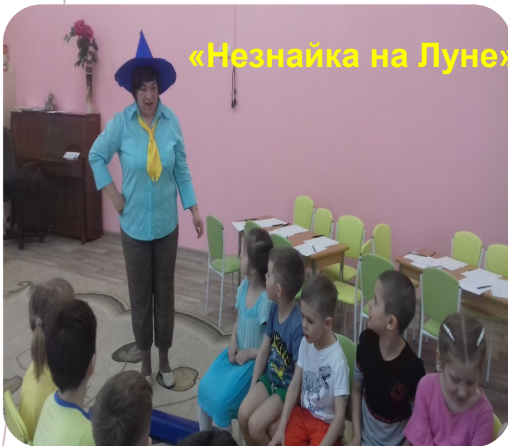
«Незнайка на Луне»