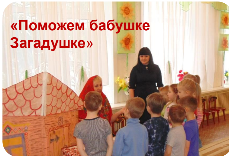
«Поможем бабушке Загадушке»