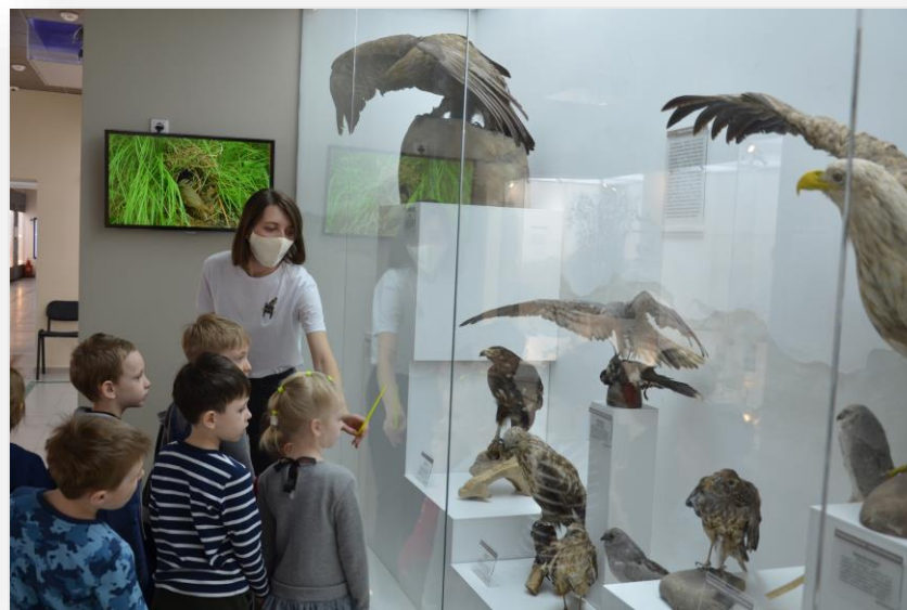
Экскурсия в краеведческий музей г. Новосибирска