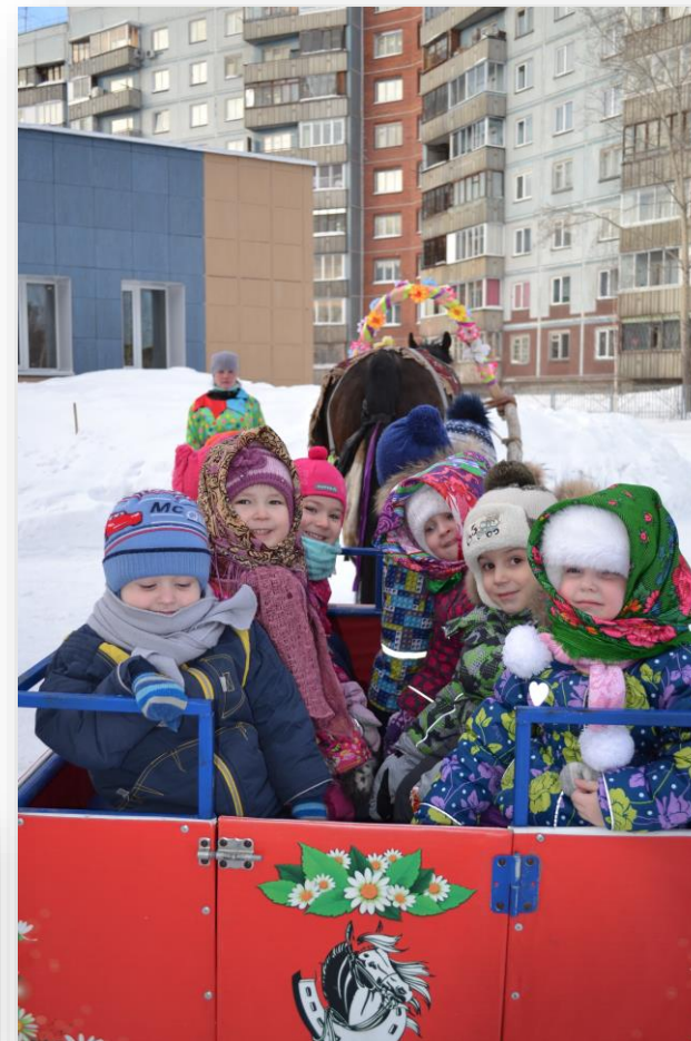
Контактный зоопарк в гостях у детей