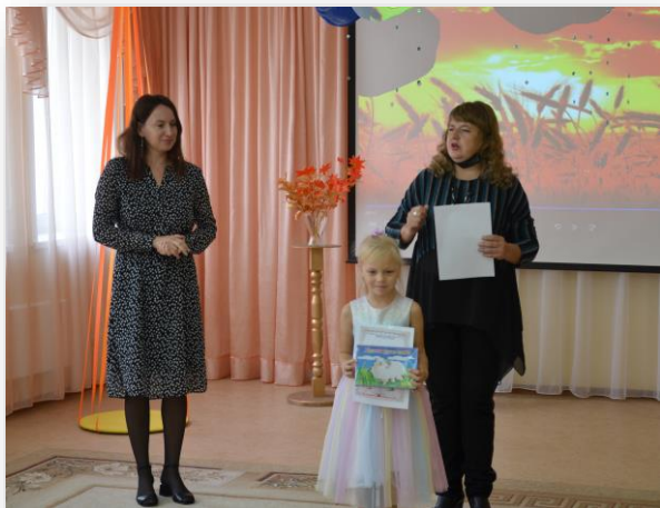
Конкурс стихов совместно с библиотекой братьев Гримм

Позитивная социализация в рамках взаимодействия с социальными институтами и учреждениями образования, культуры и спорта